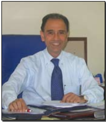
Il presidente Mauro Spada

Cari Cittadini, eccoci arrivati alla fine del 2010, che possiamo definire un anno difficile, in cui molti hanno vissuto direttamente la crisi economica, che ha toccato sia le famiglie che le fasce più deboli della popolazione, come gli anziani. Dobbiamo dire che anche per l'amministrazione pubblica non è stato un anno semplice, ma un periodo nel quale abbiamo cercato di gestire al meglio le risorse messe a disposizione della Circo-