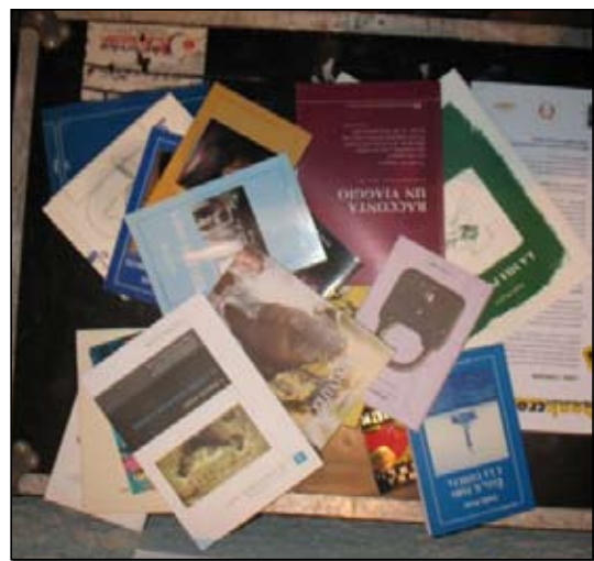
Con questo sistema la cultura circola più facilmente

Ha preso avvio anche nella nostra Circoscrizione il progetto "Bookcrossing" o "Libri in libertà". Si tratta di un movimento culturale diffuso a livello mondiale, che ha come obiettivo la promozione della lettura attraverso lo scambio gratuito di libri e la condivisione di diverse