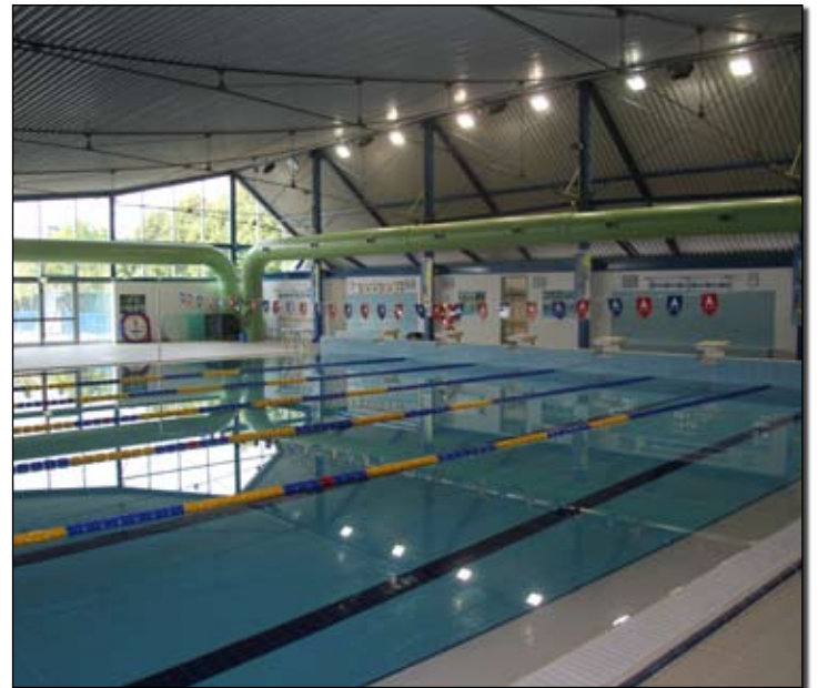
Il quartiere torna ad appropriarsi di una struttura sportiva importante

L'attesa è finita e le promesse sono state mantenute. È stato infatti inaugurato, alla presenza di numerosi cittadini e curiosi provenienti dai quartieri vicini, il nuovo centro natatorio "Belvedere" di via Montelungo, che sarà in gestione alla associazione Sport & Management. Dopo quattro anni dalla chiusura per inagibilità viene così restituito alla comunità un impianto, dal 1979 senza significativi interventi, totalmente rinnovato. Inoltre, al di là dei vari lavori di rifacimento sull'opera originaria, sono state approntate ulteriori migliorie, come la realizzazione di una piccola palestra e la sostituzione delle pareti vetrate con altre in linea con la normativa in materia di sicurezza e risparmi energetici. Un impianto messo a nuovo quindi, come prova il finanziamento stanziato di un milione di euro, che viene ad allargare quella "Cittadella dello sport", come hanno voluto segnalare gli assessori Federico Sboarina e Vittorio Di Dio,