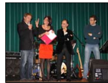
Protagoniste le associazioni

Una splendida e salutare rassegna dello sport più vero. Se si dovesse sintetizzare quello che si è visto venerdì 12 novembre sul palco del teatro Aurora di Borgo Venezia non si potrebbero che usare queste parole. Promossa dalla Sesta Circoscrizione è andata in scena la prima edizione del Galà dello Sport, un mix ben riuscito tra sport, buona musica e, perché no, tanta umanità. Protagoniste della serata le associazioni sportive